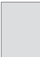
1/1 Anschnitt 215,00 x 280,00 mm zuzügl. 5 mm Beschnitt