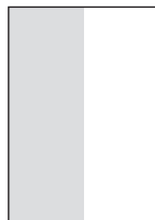
1/2 Anschnitt hoch 107,50 x 280,00 mm zuzügl. 5 mm Beschnitt