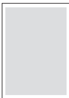
1/1 Satzspiegel 191,00 x 256,00 mm