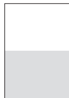
1/2 Anschnitt quer 215,00 x 140,00 mm zuzügl. 5 mm Beschnitt