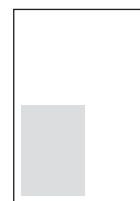
1/4 Satzspiegel hoch 88,50 x 122,00 mm